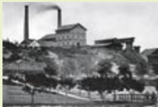
Důl Julius (1888)