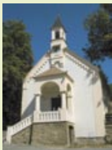
Kaple sv. Jana Křtitele

Na místě kaple stával původně tzv. Cechhaus, kde se shromažďovali horníci před sfáráním do dolu Julius a kde obdrželi denní pracovní rozkazy. Později zde byl umístěn konzum a roku 1911 byl dům přestavěn a vysvěcen na kapli sv. Jana Křtitele – patrona horníků.