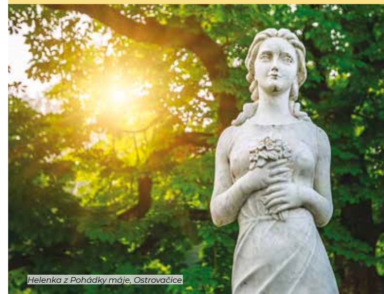
Helenka z Pohádky máje, Ostrovačice