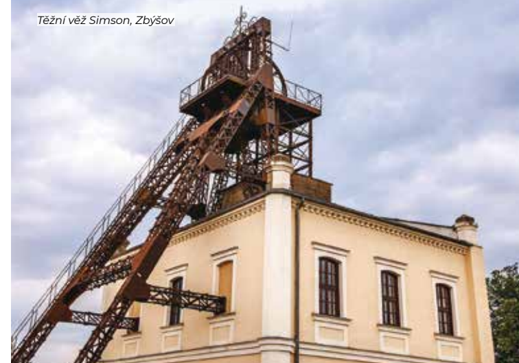
Těžní věž Simson, Zbýšov

Poznejte místa, kde se ještě před třemi desítkami let rubalo černé uhlí a odehrál se příběh slavné Pohádky máje