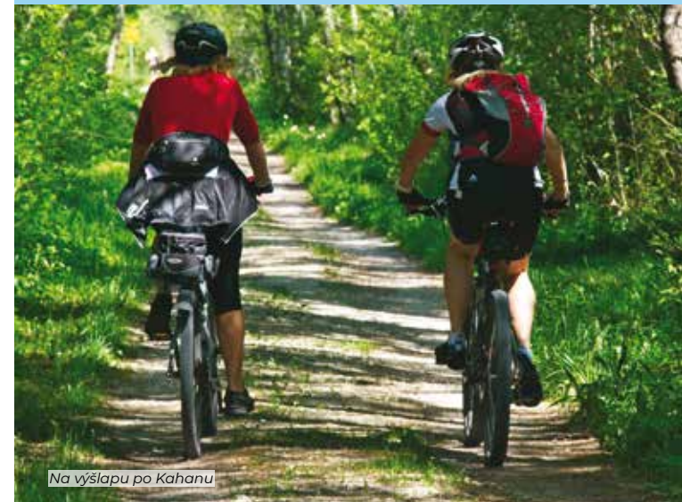
Na výslapu po Kahanu

Projeďte si na kole krásy, zajímavosti i odkazy na někdejší hornickou minulost Mikroregionu Kahan. A připravte se na božskou koupačku!