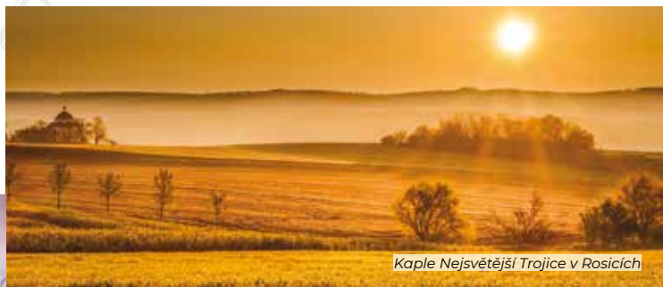
Kaple Nejsvětější Trojice v Rosicích

OSTROVAČICE – MASARYKŮV OKRUH – HELENČINA – STUDÁNKA – OSTROVAČICE – ŘÍČANY (BIOTOP, HRADISKO) – OSTROVAČICE / Kombinace cyklotras a turistických tras. Popis trasy a dalších „pohádkomájových“ výletů najdete na webu. Od říčanského Hradiska je možné trasu o 10 km prodloužit o Říčky, Javůrek a Veverské Knínice.