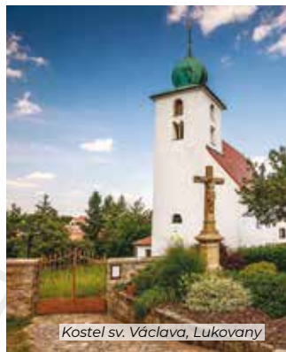
Kostel sv. Václava, Lukovany

Pokud patříte mezi milovníky sakrální architektury, určitě zamiřte do Lukovan, Příbrami a Řičan. Zdejší kostely jsou unikátní. Lukovanský kostel sv. Václava patří mezi nejstarší v regionu, jeho základy jsou románské. Příbramský je naopak těžká moderna. Řičanský je zase zajímavý svou atypicky na druhou stranu orientovanou sakristií, proto se Řičanským říká „rakaň“.