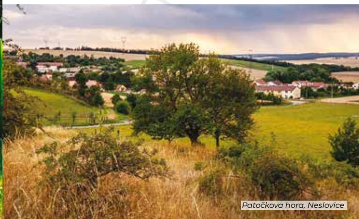
Patočková hora, Neslovice

Oficiální trasy, cyklotrasy i výlety „bočními“ uličkami najdete ve speciální sekci Putuj za permoniky na webu www.mikroregionkahan.cz .