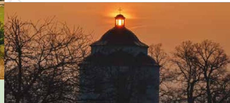
Kaple Nejsvětější Trojice, Rosice

Až na Alpy a Pálavu uvidíte ze zbyšovské haldy, umělého kopce z hlušiny. Vytěžené kamení, které nevydalo černé uhlí, se zde kupilo dvě století, kdy se těžilo v areálu blízkých dolů Antonín, Jindřich a Jindřich II. Jeho pozůstatky jsou z haldy stále vidět. Výhledy vás čekají také z odvalu dolu Ferdinand u Babic, tady se můžete rozhlížet opačným směrem, k Dražanské vrchovině. Halda „Ferdinandky“ je mnohem příkřejší než zbyšovská a na konci pozor, je zde prudký sráz dolů.