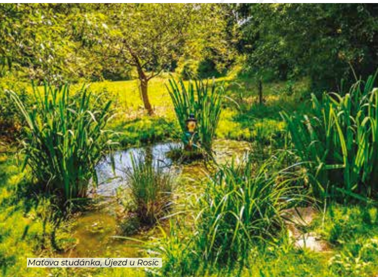
Maťova studánka, Újezd u Rosic

Skvělým výletním cílem je (zřejmě) bývalý hrad nedaleko Řičan, na kopec se stále rozpoznatelnými příkopy narazíte po cestě od biotopu k Řičkám. Je to krátký, ale ostrý výstup. Řičanští ze Zámečku, jak hradisko nazývají, udělali skvělé piknikové místo. V noci by se zde měly pohybovat jen nebojácné povahy, k místu se váže legenda o divém ohnivém psovi.