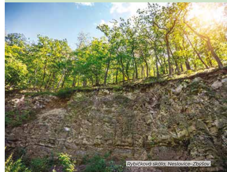
Rybičková skála, Neslovice-Zbýšov