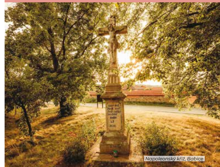
Napoleonský kříž, Babice