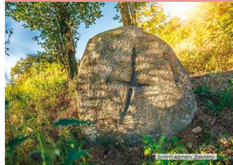
Smírčí kámen, Zakřany

Poznejte místa Mikroregionu Kahan, kde mrazí. Projděte se kolem křížů, smírčích kamenů, po místech tajemných